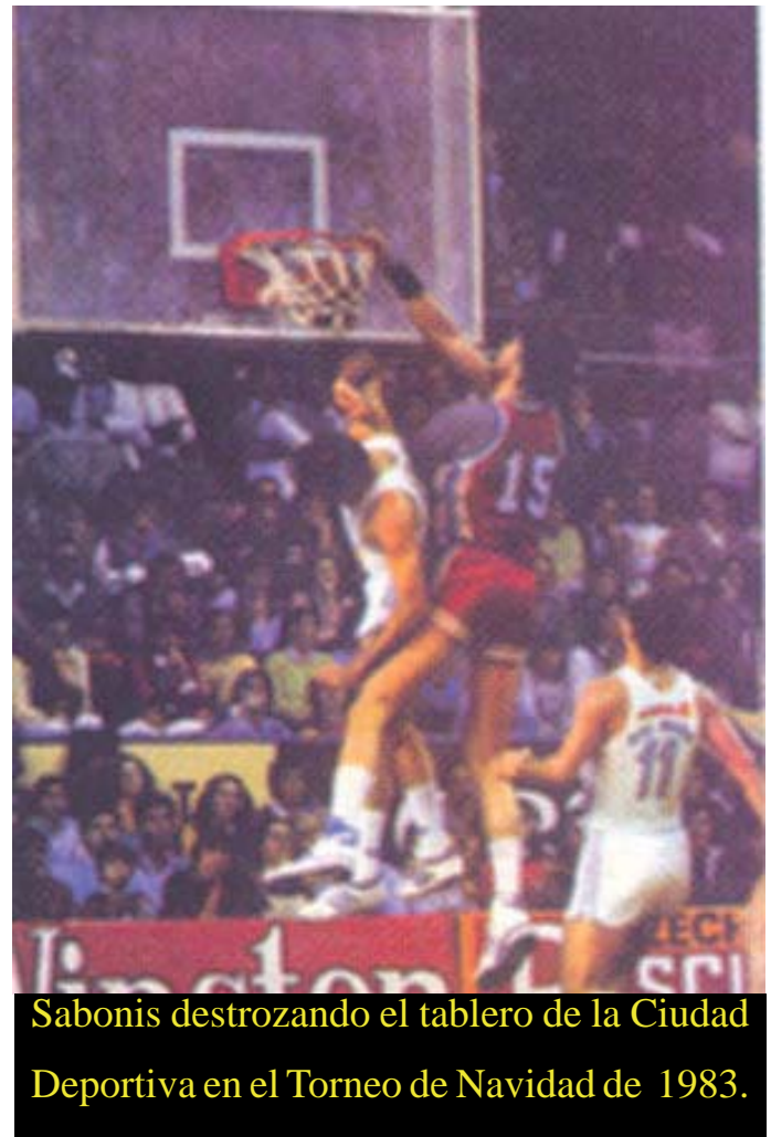
Sabonis destrozando el tablero de la Ciudad Deportiva en el Torneo de Navidad de 1983.

Efectivamente, North Carolina University, la cuna del baloncesto norteamericano (o una de ellas, por si en Indiana se nos enfadan), entrenada por el legendario Dean Smith, hacía acto de presencia con una serie de jugadores bastante reconocibles para el gran público, aunque algo alejada de la mítica de principios de los 80 con