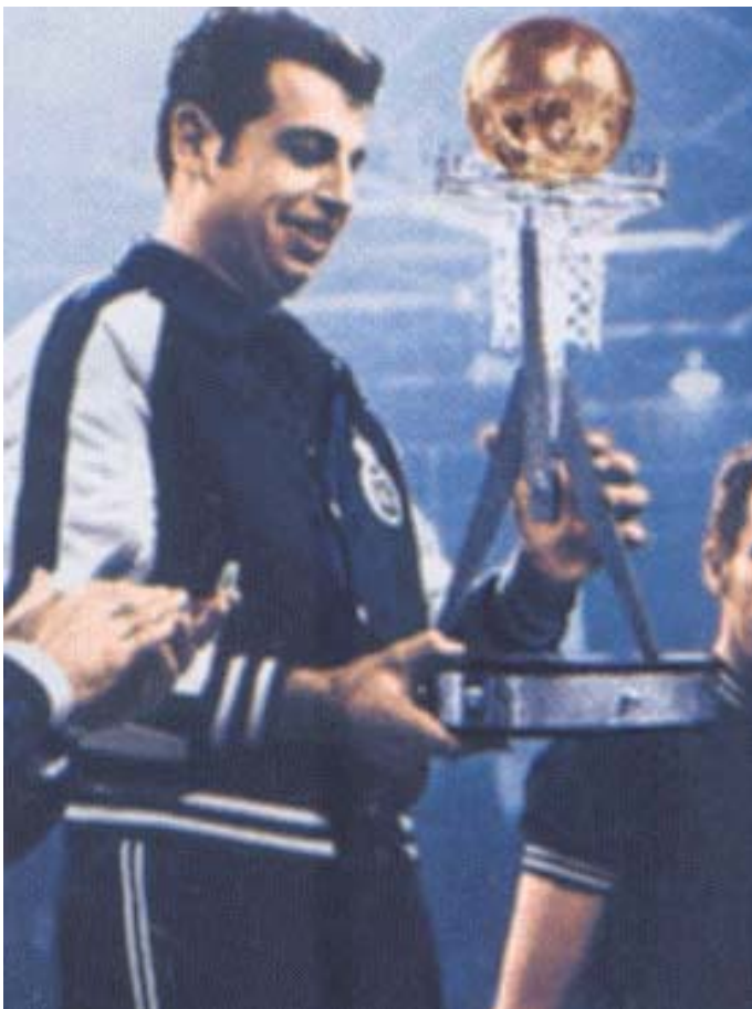
Sevillano alzó el I Torneo de Navidad de la historia.

pero los aficionados al baloncesto blanco con una cierta antigüedad -y quiero creer que muchos de otros equipos- tenemos un cierto regusto amargo, nos falta algo, como si una pieza del puzzle navideño se hubiera perdido para siempre. Ya han pasado algunos años desde que se disputó el último Torneo de Navidad.