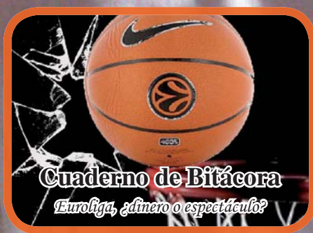
Cuaderno de Bitácora Euroliga, dinero o espectáculo?