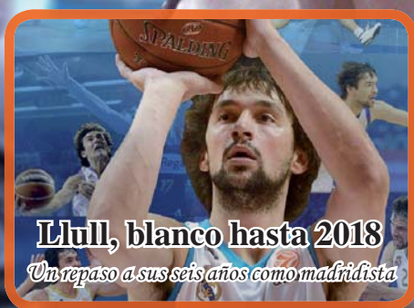
Llull, blanco hasta 2018 Un repaso a sus seis años como madridista