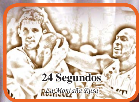
24 Segundos La Montaña Rusa