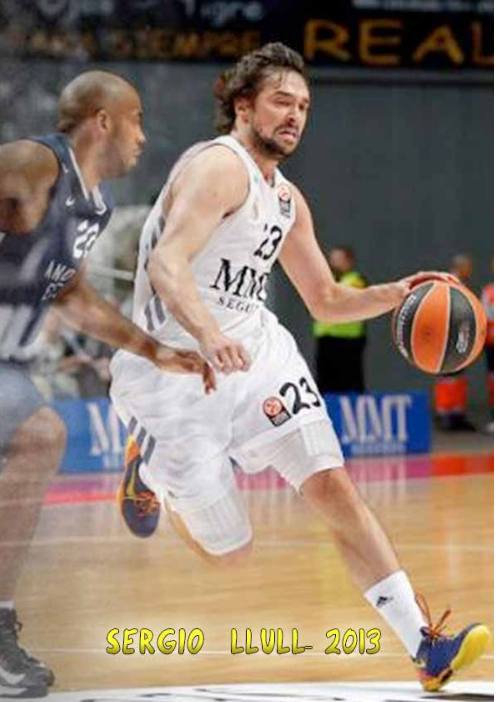
SERGIO LLULL- 2013