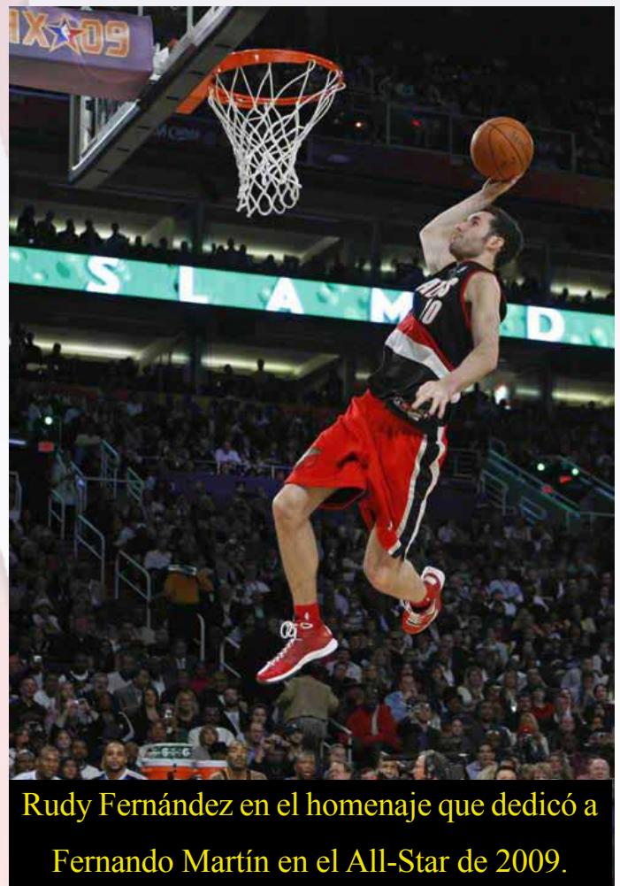
Rudy Fernández en el homenaje que dedicó a Fernando Martín en el All-Star de 2009.

¿Constituyeron un éxito estos tres años? Si nos teletransportáramos hasta hace 25 años nadie dudaría en que sí, y clamoroso. En la actualidad, y dado el carácter tan nuestro que tenemos en este país, muchos opinan que no, sobre todo cuando la vara de medir se llama