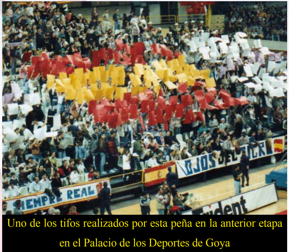
Uno de los tifos realizados por esta peña en la anterior etapa en el Palacio de los Deportes de Goya

Pero nosotros no nos conformamos, queremos seguir creciendo y es por ello por lo que agradecemos el